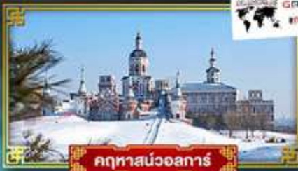
คฤหาสน์ออลการ์

อลังการงานแกะสลักน้ำแข็งระดับโลก Harbin Ice Festival