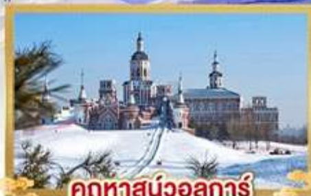
คฤหาสน์วอลการ์