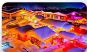
หมู่บ้านทยี่ม