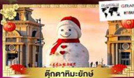
ตุ๊กตาหิมะยักษ์

เที่ยวเทศกาลน้ำแข็งระดับโลก "ฮาร์บิ้น" ชมแสงสีหมู่บ้านหิมะสุดน่ารัก