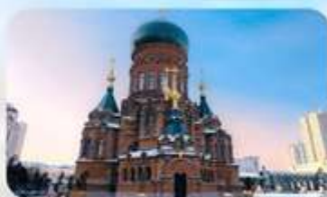
โบสถ์เซนโซเฟยี่