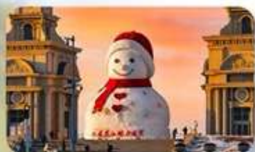
ตุ๊กตาทยี่ม-ยักซ์