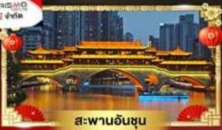
สะพานอันซุน