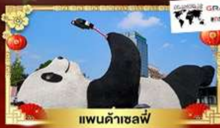
แพนด้าเซลฟ์

เที่ยวสวิสเซอร์แลนด์แดนมังกร "กู๋เขาสีดรุณี" อุทยานซ็องกุ๋เหนียงซาน