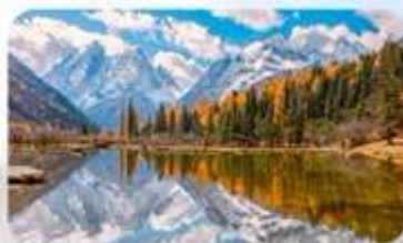
สี่ครุณี