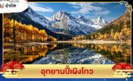
อุทยานปี้ฝิงโกว