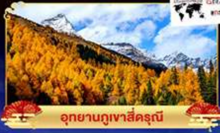
อุทยานภูเขาสีครุณี

อุทยานสวรรค์ภูผาหิมะการ์เซียคำกู่ปิงชุน เที่ยว 3 อุทยาน "ชมนิมะบนยอดเขาและใบไม้เปลี่ยนสี"