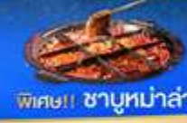
พิเศษ!! ชาบูหม่าล่า