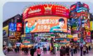
ถนนคนเดินหวงซิงลู่