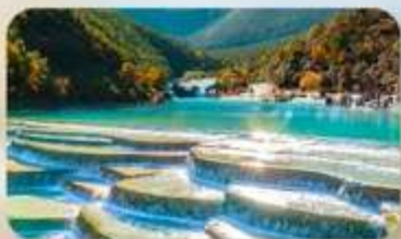
เป่ย์ซู่เหอ