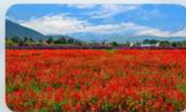
สวนฮวาอวี๋มู่ฉ่าง