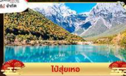
ไปลุยหิมะ