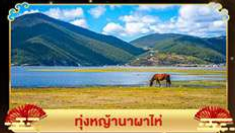
ทุ่งหญ้าบานาพาไท่