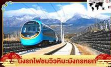
นั่งรถไฟชมวิวหิมะมังกรหยก