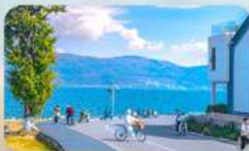
ทะเลสาบเอ๋อร์โหล่