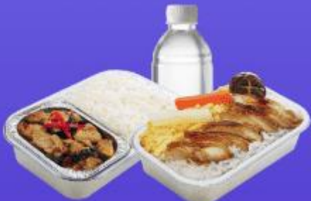
บริการอาหารร้อนบนเครื่อง ชาไป - ขากลับ

10.40 น. คณะเดินทางถึง สนามบินนานาชาตินิวซีโตเสะ ประเทศญี่ปุ่น (**เวลาที่ประเทศญี่ปุ่นจะเร็วกว่าประเทศไทย 2 ชม. ควรปรับนาฬิกาของท่านเพื่อสะดวกในการนัดหมาย) หลังผ่านพิธีตรวจคนเข้าเมืองแล้ว นำท่านรับประทานอาหารกลางวัน