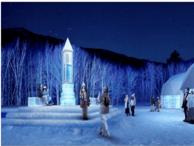
TOMAMU ICE VILLAGE

หมายเหตุ การเปิดให้บริการของ Tomamu Ice Village ขึ้นอยู่กับสภาพอากาศเป็นหลัก ทั้งนี้ หากอุณหภูมิเพิ่มสูงขึ้นจนส่งผลให้น้ำแข็งละลายเร็ว อาจทำให้ต้องปิดให้บริการก่อนกำหนดที่วางไว้ ขอสงวนสิทธิ์ทดแทนเป็นรายการอื่น หรือคืนค่าใช้จ่ายในส่วนนี้ตามความเหมาะสม