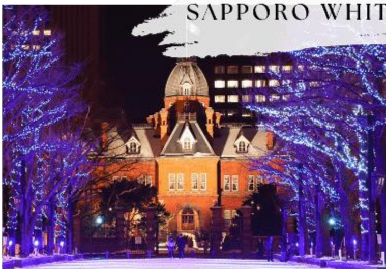
SAPPORO WHITE ILLUMINATION