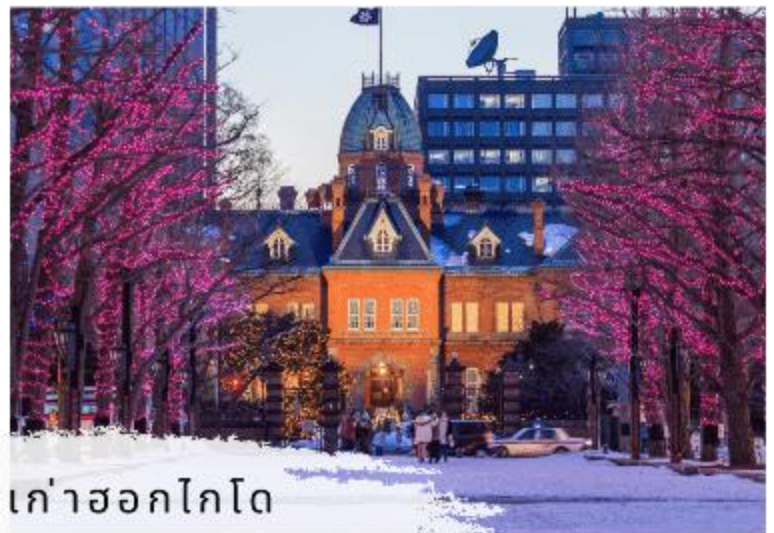
ศาลาว่าการเก่าฮอกไกโด