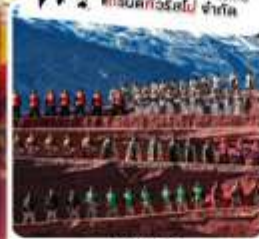
ชมโชว์ Impression Lijiang