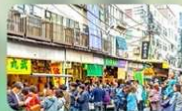
ตลาดปลาสึกิจิ