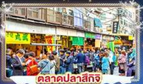
ตลาดปลาสึกิจิ