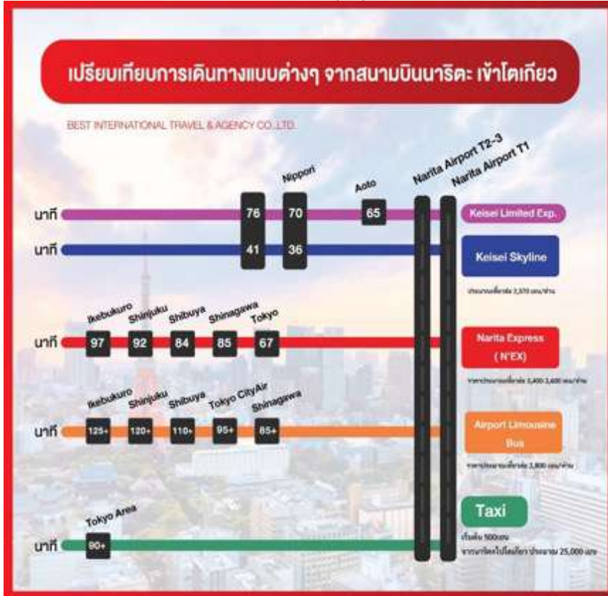
ตารางเปรียบเทียบราคาการเดินทางเข้าในเมืองโตเกียว

- ห้าแยกชิบูย่า ซึ่งเป็นศูนย์กลางของย่านธุรกิจสำคัญของกรุงโตเกียวที่เต็มไปด้วย ห้างสรรพสินค้า ร้านค้า เสื้อผ้าแบรนด์เนมและแฟชั่นจากทั่วทุกมุมโลก