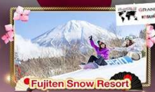
Fujiten Snow Resort