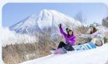
Fujiten Snow Resort