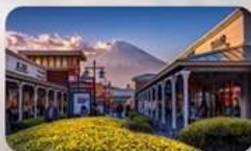
โตเกียวเบะ