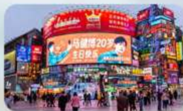
ถนนคนเดินหวงซิงอู๋