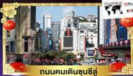
ถนนคนเดินชุนชี่ลู่

"เที่ยวอุทยานแสวรรดระดับ 5 A" ชมความสวยของฤดูใบไม้เปลี่ยนสีที่จีน