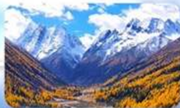
ภูเขาสีครุณี