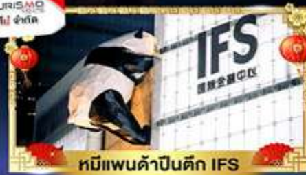
หมีแพนด้าปิ่นตึก IFS