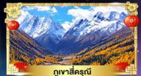
ภูเขาสิ่ครุณี