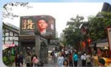
ถนนชอยกวางชอยแคว