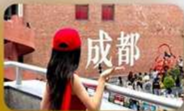
ดงเจียวจี้