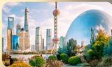
นอร์ทบิ้นด์กรีนแลนด์