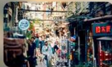
ถนนเทียนจื่อฟาง