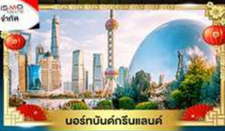
นอร์ทบิ้นด์กรีนแลนด์