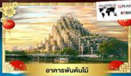
อาคารพันต้นไม้