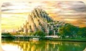
อาคารพินตันไม้