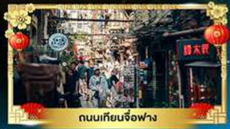
ถนนเทียนจื่อฟาง