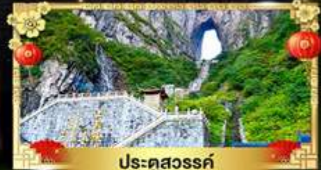
ประดู่สวรรค์