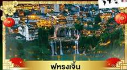
ฟุรงเจิน