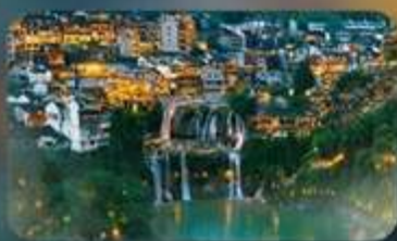
ฟูทงเจิ้น