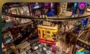
เหวินเหอไหย่