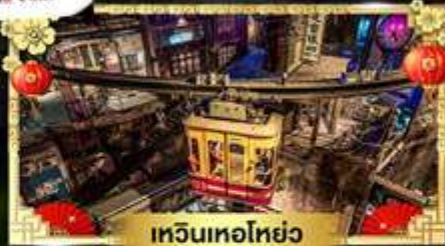
เหวินทอโฮ่ย