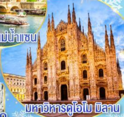
มหาวิหารดูโอโม มิลาน