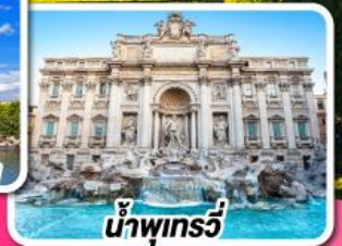
น้ำพุทรวี