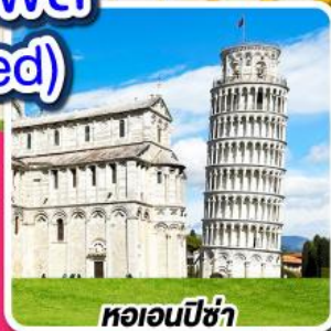
หอเอินปิซ่า