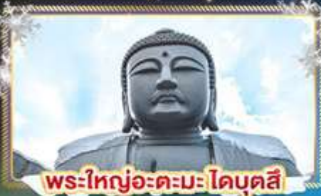
พระใหญ่อะตะมะ โดบุตสึ