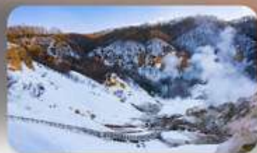
จิกุกุคานี