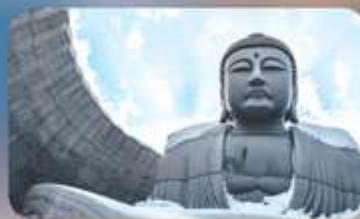
พระใหญ่อะตะมะ โดบุคสึ