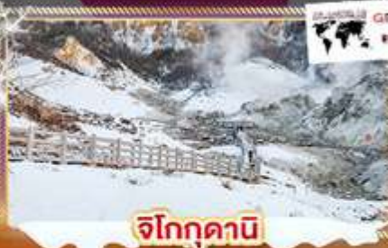
จิโกกุดานิ

📅 เดินทาง : 28 ธ.ค. 68 - 1 ม.ค. 69 / 29 ธ.ค. 68 - 2 ม.ค. 69 / 30 ธ.ค. - 3 ม.ค. 69 / 31 ธ.ค. - 4 ม.ค. 69