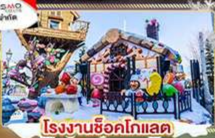
โรงงานช็อคโกแลต