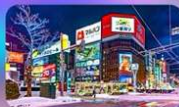
ซูซุกิโนะ