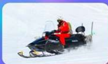
สโนว์โมบิล