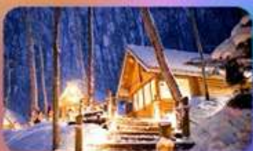
นิงเกิ้ลทอเรซ