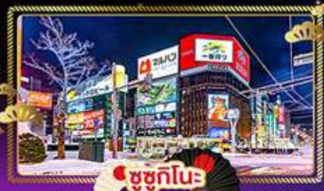
🛍️ ชูชุกินะ