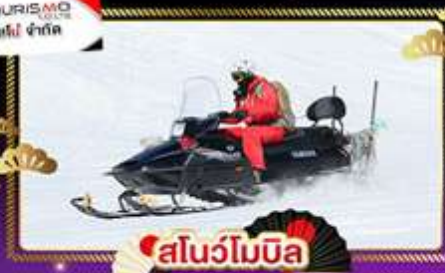
🏂 สโนว์โมบิล