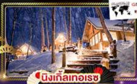
♨️ นิงเกิ้ลออนเซน

📅เดินทาง : 28 ธ.ค. 68 - 2 ม.ค. 69 | 29 ธ.ค. 68 - 3 ม.ค. 69 30 ธ.ค. 68 - 4 ม.ค. 69 | 31 ธ.ค. 68 - 5 ม.ค. 69