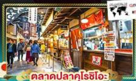
ตลาดปลาคุโรชิโอะ