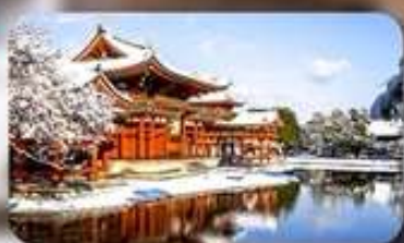
วัดเบียวโดอิน