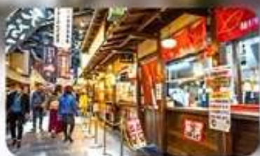
ตลาดปลาคุโรชิโอะ