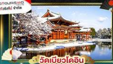
วัดมียวไดอิน