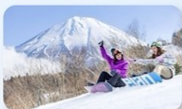
Fujiten Snow Resort