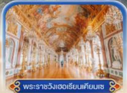
พระราชวังเฮอเรียมเคียมเซ