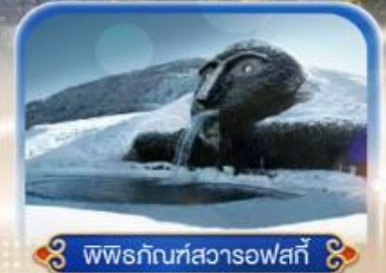
พพิธภัณฑสวารอฟสกี

เข้าชมปราสาทและพระราชวังอันสวยงามของแคว้นบาวาเรีย ถึงปราสาทนอยชวานสไตน์ , พระราชวังลินเดอร์ลอฟและ พระราชวังเฮอเรียมเคียมเซ