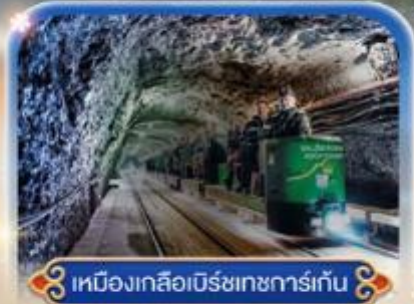
เหมืองเกลือเบียร์ชกการ์เกิน