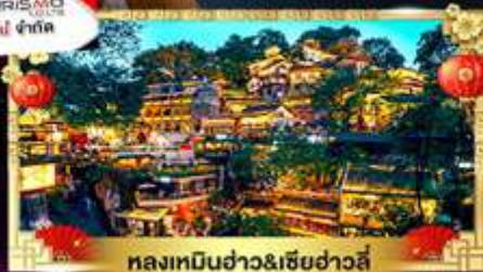
หลงเหมินฮ่าว&เซียงฮ่าวลี