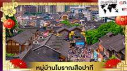
หมู่บ้านโบราณสี่ปาเก้

เที่ยวเมืองมหัศจรรย์ "มณฑลแคว้นเซียง" ถ่ายรูปเช็คอินจุดต่างๆตามรอยพี่สาวจีน