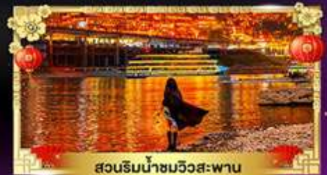
สวนริมน้ำชมวิวดงสะพาน