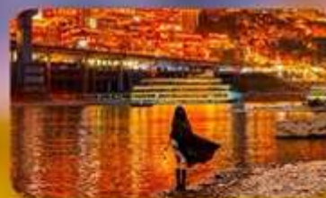
สวนริมน้ำชมวิวสะพาน