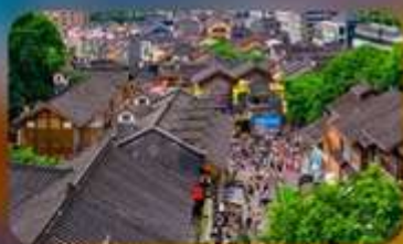
หมู่บ้านโบราณสื่อปาตี้