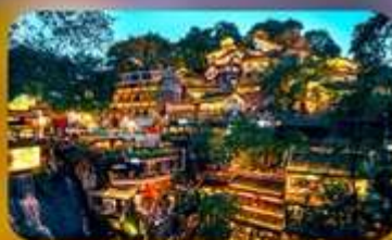
หลงเหมินฮ่าว&เซี่ยฮ่าวลี่