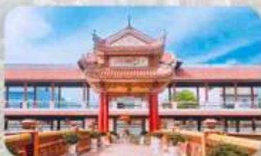
วัดนามเชิน