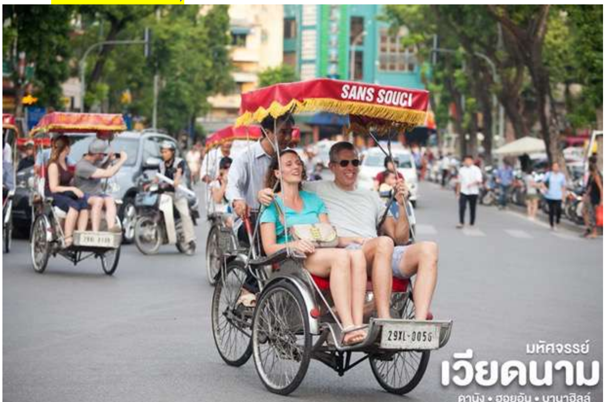
มหัศจรรย์ เวียดนาม คาบัง • ฮอยอัน • บานาฮิลล์