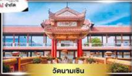
วัดนามเชิน