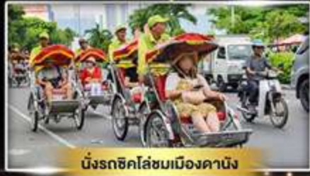
นั่งรถถีบไล่ชมเมืองดานัง