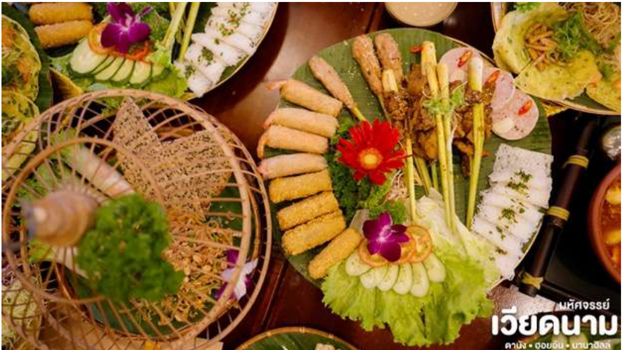
มหัศจรรย์ เวียดนาม คาบัง • ฮอยอัน • บานาฮิลล์