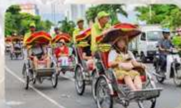
นั่งรถซิคโด้ชมเมืองดานัง