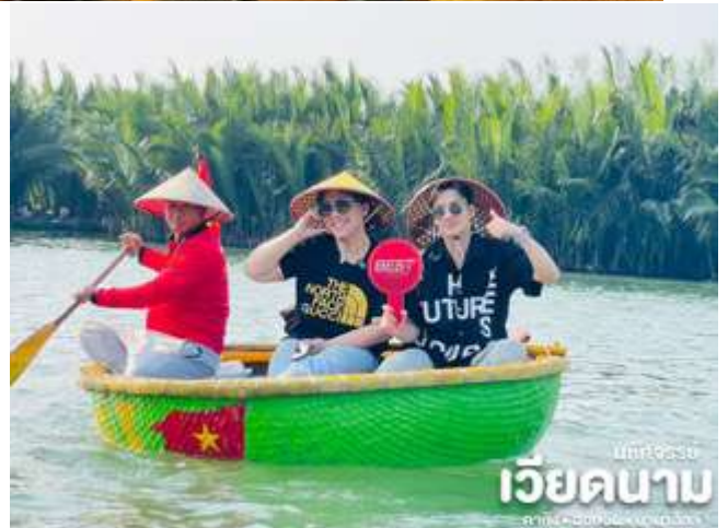
บริษัททัวร์ริสโม เวียดนาม โทร : 02-508-1010

จากนั้น นำท่านเดินทางสู่ หมู่บ้านกัมทาน สนุกสนานไปกับกิจกรรม!! นั่งเรือกระดัง Cam Thanh Water Coconut Village หมู่บ้านเล็กๆ ในเมืองฮอยอัน ตั้งอยู่ในสวนมะพร้าวริมแม่น้ำ ในอดีตช่วงสงครามที่นี่เป็นที่พักอาศัยของเหล่าทหาร อาชีพหลักของคนที่นี่คืออาชีพประมง ระหว่างการล่องเรือท่านจะได้ชมวัฒนธรรมอันสวยงาม ชาวบ้านจะขับร้องเพลงพื้นเมือง ผู้ชายกับผู้หญิงจะหยอกล้อกันไปมานำที่พายเรือมาเคาะกันเป็นจังหวะดนตรีสุดสนุกสนาน (ไม่รวมค่าทิปคนพายเรือ ท่านละ 50 บาท/ต่อท่าน/ต่อทริป)