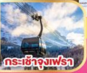
กระเช้าจุ่งเฟรา

พิเศษ! เข้าชมปราสาทไคเดิลเบิร์ก ปราสาทหินทรายแดงที่สวยงามที่สุด มือสุดพิเศษ รับประทานอาหารบนหอไอเฟลอันสุดโรแมนติก