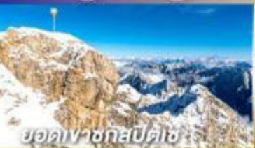
ยอดเขากอสเปลด์ช