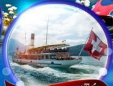
ล่องเรือทะเลสาบลูซิิร์น