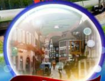
หมู่บ้านริเบอร์วิลส์