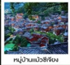
หมู่บ้านแม่วชิเจียง