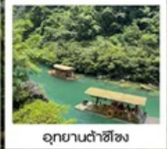
อุทยานต้าซือชง

น้ำตกหวงกั๋วซู่ / อุทยานเทียนชิ่งเฉียว / น้ำตกโต่วพิ่วถาง หมู่บ้านแม่วชิเจียง / อุทยานเสี่ยวซือชง / อุทยานต้าซือชง เมืองโบราณชิ่งเหยียน / หอเจี๋ยชิวโหลว / ถนนคนเดินจินปี้ลู่