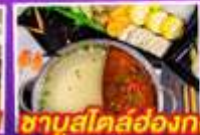
ชาบูสโกลฮ่องกง