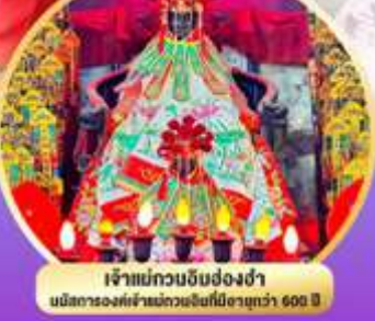
เจ้าแม่กวนอิมง่งง่า นมัสการองค์เจ้าแม่กวนอิมที่มีอายุกว่า 600 ปี