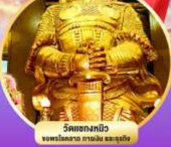
วัดเขangkมปีว ขอพรโลกสวย ภายใจ สมะลุเอ็ง