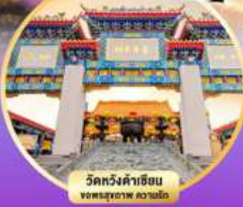
วัดหวังคำเซียน ของพระอาจารย์ หลานรัก