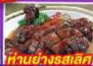
ทานอย่างรสเลิศ