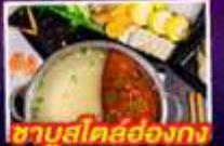
ซาบุดีตี้ฮ่องกง