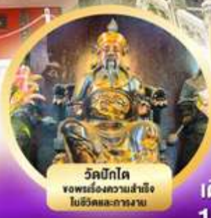
วัดบิกโต ขอพรเรื่องความสำเร็จ ในชีวิตและทางสาย