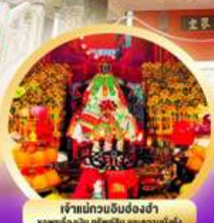
เจ้าแม่ทวนจี้บ๊องซำ ขอพรเรื่องเงิน ทรัพย์สิน และความสำเร็จ