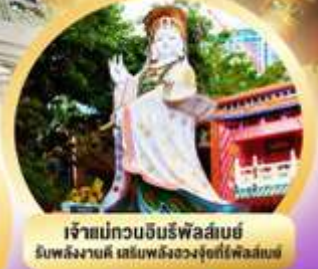
เจ้าแม่ทวนจี้บ๊องซำ ขอพรเรื่องเงิน ทรัพย์สิน และความสำเร็จ