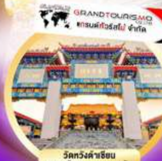
วัดหวังคำฮุย ขอพรข้ามสุกขาว ความรัก