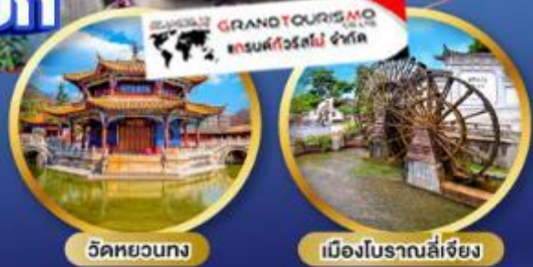
วัดหยวนกง