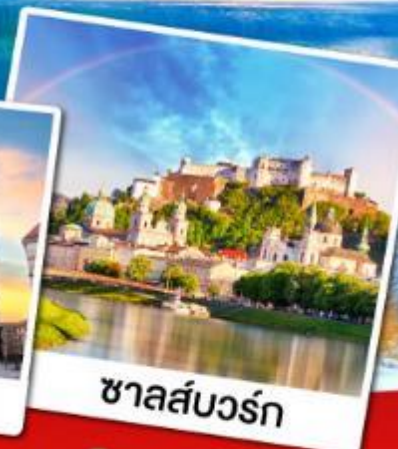
ชาลส์บวร์ก