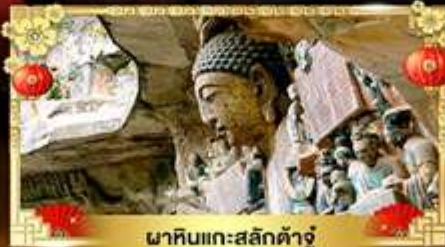
พาคินแกะสลักต้าจู้