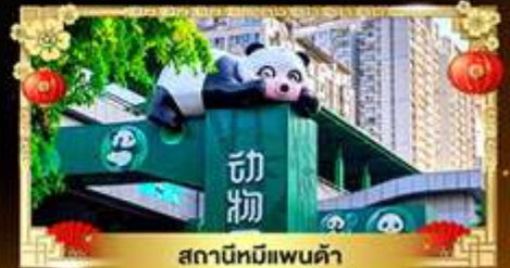
สถานีหมีแพนด้า