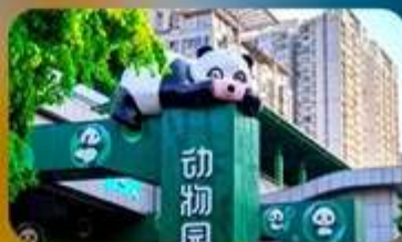
สถานีหมี่แพนต้า