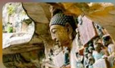
ฆาหินแกะสลักต้าจู้