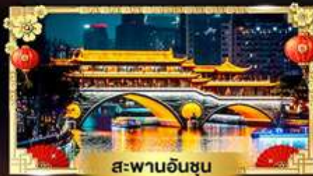
สะพานอันชุน