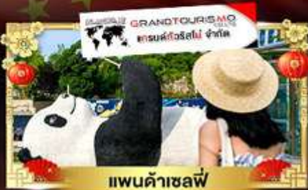
แพนด้าเซลฟี

เที่ยวอุทยานสวรรค์ระดับ 5A จิวจ้ายโกว "กู๋เจาสีดรุณี" อุทยานชื่อดังเหนียงชาน