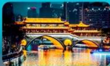
สะพานอันชุน