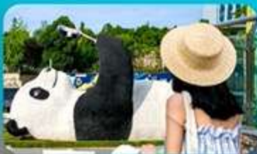
แพนด้าเซลฟี