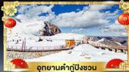
อุทยานต้ากู่ปิงชวน