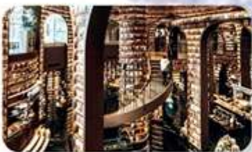
ร้านหนังสือจงซูเก๋อ