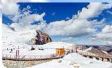
อุทยานคำกู่ปิงชว