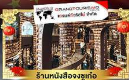
ร้านหนังสือจงซูเก๋อ

ดินแดนสวรรค์ความสูง 4,860 เมตร "ต้ากู่ปิงชาน & กู๋เจาสีดรุณี"