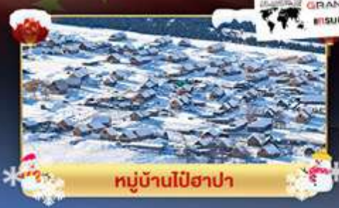
หมู่บ้านไปฮาปา