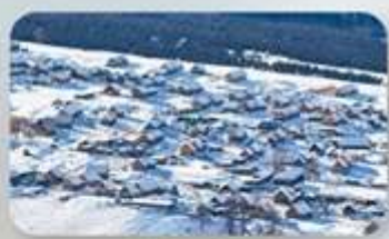
หมู่บ้านไปฮาปา