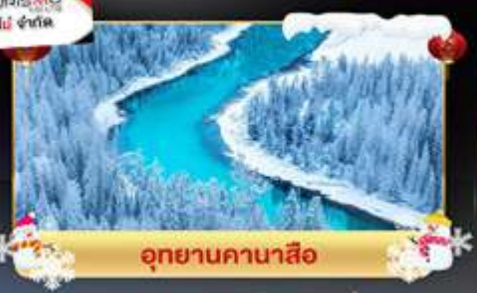
อุทยานคานาสือ