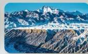
แกรนด์แคนยอนตูซานจื่อ