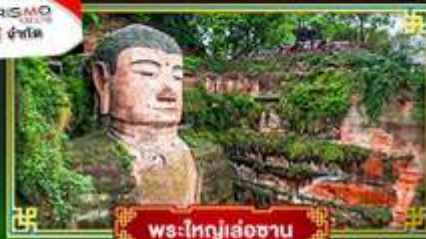
พระใหญ่เล่อซาน