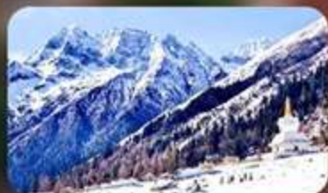
ภูเขาสิ่ดรุณี