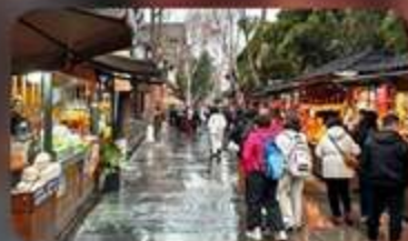
ถนนชอยกั๋ววงชอยแคบ