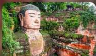
พระใหญ่เล่อซาน