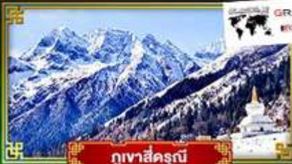
ภูเขาสิ่วรุณี

ชมวิวดูหนาวสุดอลังการอุทยานภูเขาสิ่วรุณี