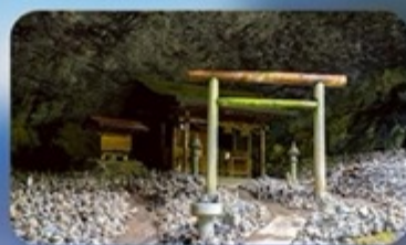
ศาลเจ้าอามาโนะ อิวาโตะ