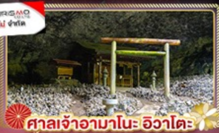
ศาลเจ้าอามาโนะ อิวาโตะ