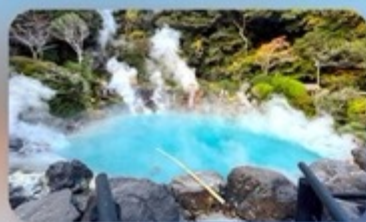
บ่อฟ้ายูมิจิโกกุ