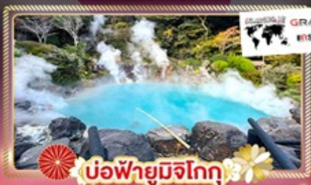
บ่อน้ำพุร้อนมิจิโอกะ