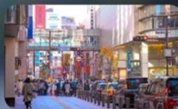
ซูปป์ิงย่านเทนจิน