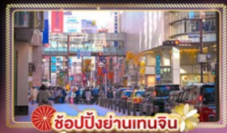
ช้อปปิ้งย่านเทนจิน