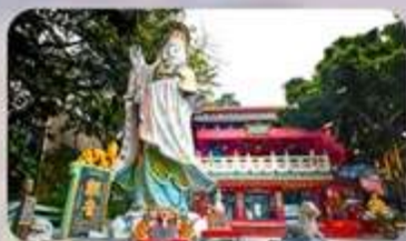
เจ้าแม่กวนอิมรีฟัลส์เบย์