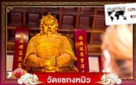
วัดชวงกวม