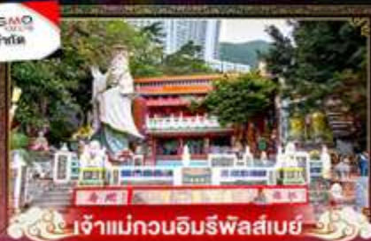
เจ้าแม่กวนอิมริพัลส์เบย์