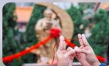
ผูกด้ายแดงสะละโสด