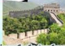
ตลาดร้อยปีเมืองหวังเหมียว กำแพงเมืองจีน ด่านจวิ๋นกงวน