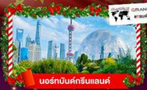
นอร์ทบิ้นด์กรีนแลนด์