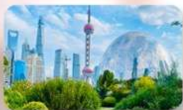
นอร์มัลกันดั๊กรินแลนด์