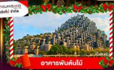
อาคารพินตันไม้