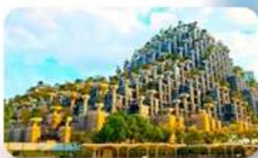
อาคารพันต้นไม้