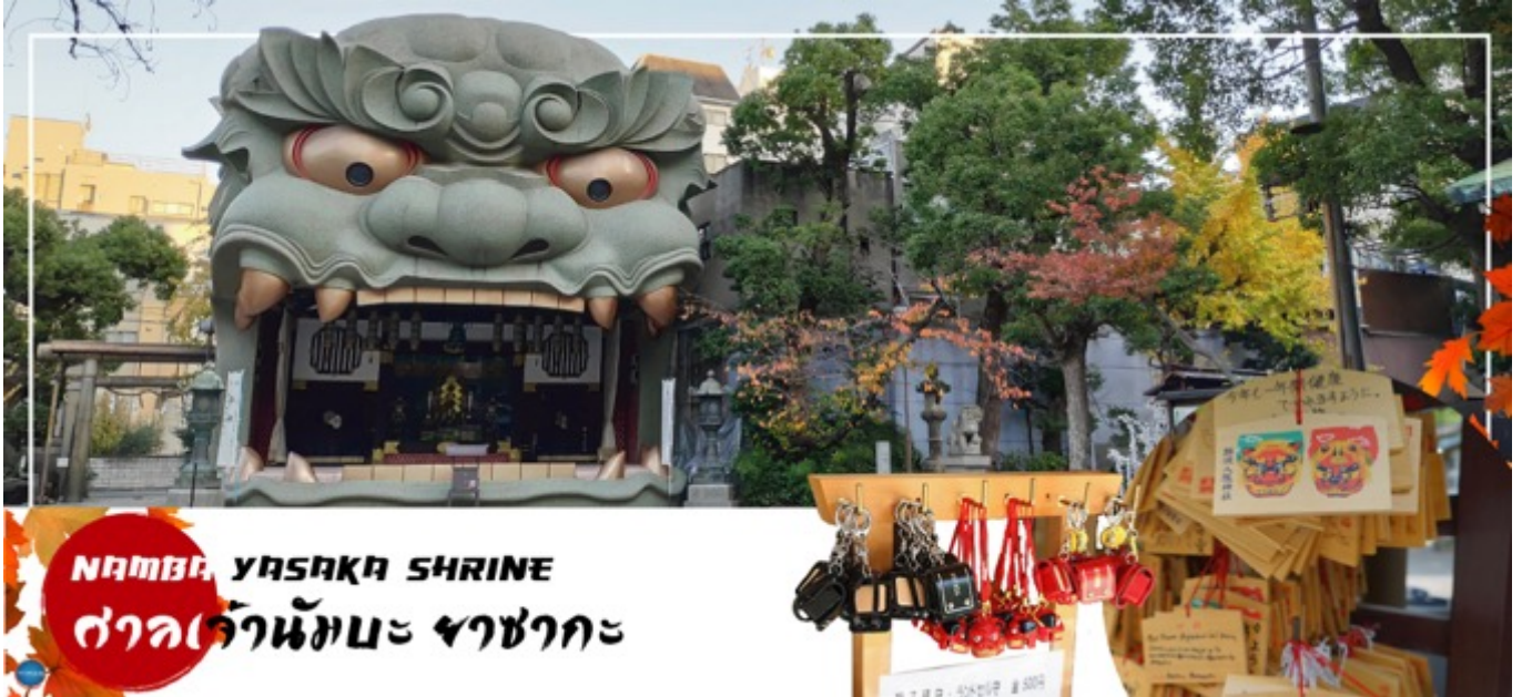
NAMBA YASAKA SHRINE ศาลเจ้านัมมะยะซากะ