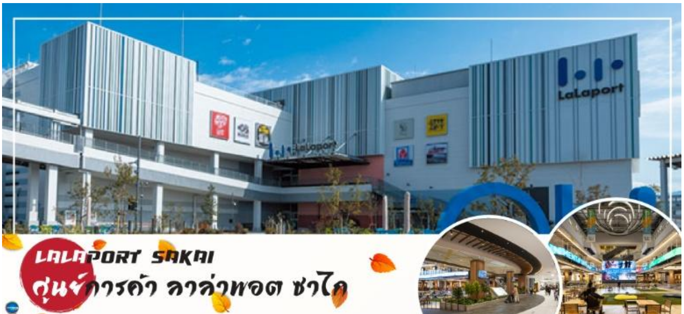
LALAPORT SAKAI ศูนย์การค้า ลาล่าพอร์ท ซากะ