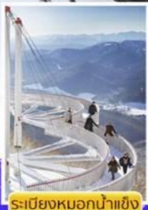
ระเบียงหมอกน้ำแข็ง