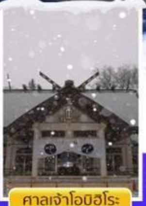
ศาลเจ้าโฮชิโอะ