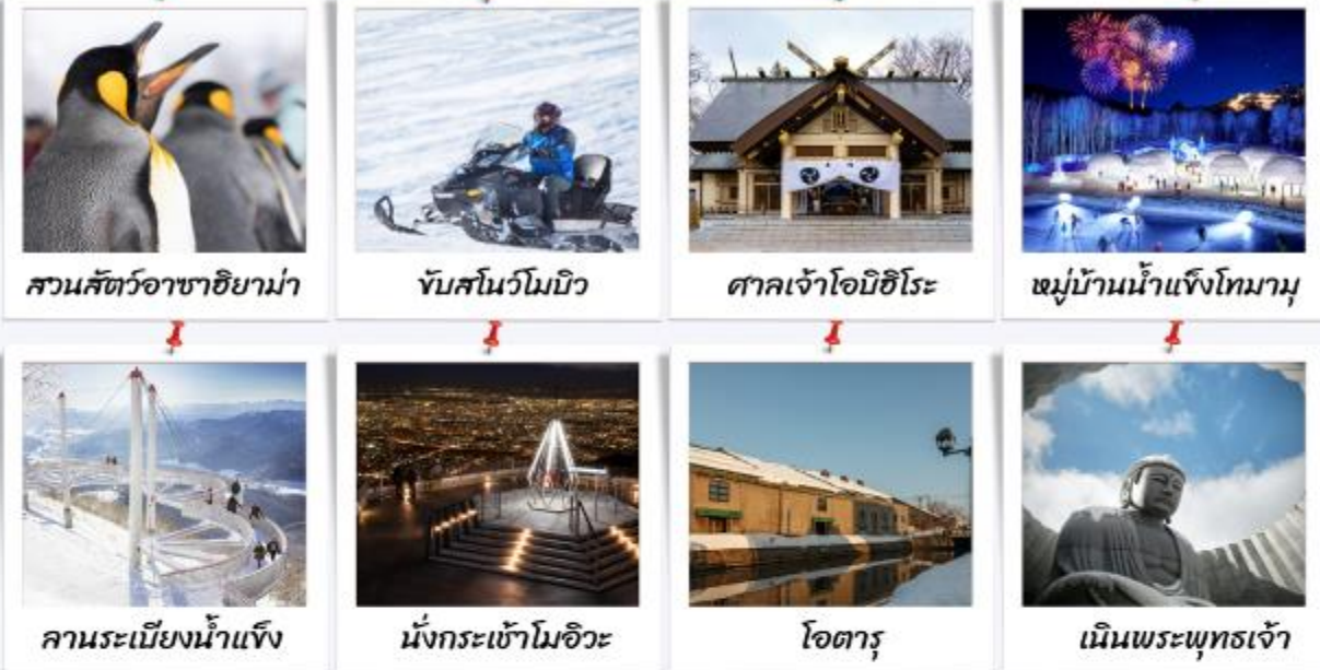
สวนสัตว์อาซาฮิยาม่า ขับสโนว์โมบิล ศาลเจ้าโอบิอิโระ หมู่บ้านน้ำแข็งโทมามุ ลานระเมียงน้ำแข็ง น้ำกระเซ็นโมอิวะ โอตารุ เนินพระพุทธรเจ้า