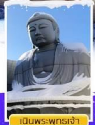
เ็นพระพุทธรเจ้า

ออนเซ็น 2 คืน นน.กระเป๋า 46 กก. 7Days 4Night