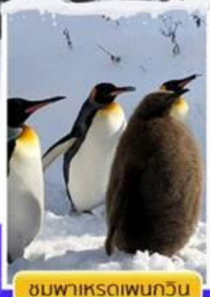
ชมพาเหรดเพนกวิน