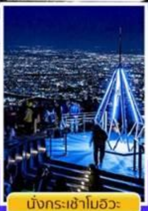
นั่งกระเช้าโมอวะ