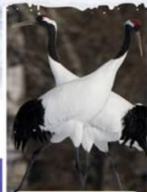
อุทยานนกกระเรียน