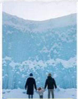
งานเทศกาลชิโคสึ