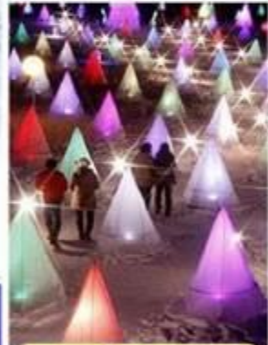
เทศกาลไฟทากาจิกว่า