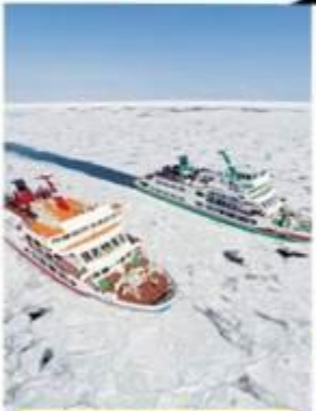
มั่งเรือตัดน้ำแข็ง