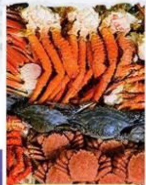
ปิ้งย่างร้านดังมีนตะ

ออนเซ็น 2 คั้น | นน.กระเป๋า 23X2 กก. | 8Days 5Night