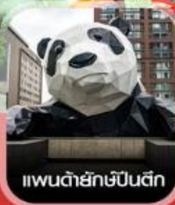
แพนด้ายักษ์ชินตัก

คอนเฟิร์มออกเดินทาง ทุกพีเรียด 2 ท่านขึ้นไป