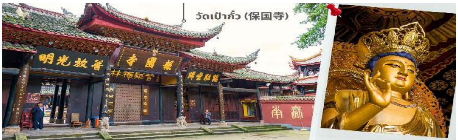
วัดเป่ากั๋ว (保国寺)

ลัทธิขงจื้อ ตั้งอยู่บริเวณด้านล่างของทราบบูเขาฟงหวง สูงจากระดับน้ำทะเล 533 เมตร ต่อมารัชสมัยคังซีฮ่องเต้แห่งราชวงศ์ชิงได้ ได้เปลี่ยนชื่อจากวัดฮู่ยงจ้งมาเป็นวัดเป่ากั๋วจนถึงปัจจุบัน ภายในมีโบราณสถานสำคัญคือ ซานเหมิน (ประตูเขา) ตำหนักหมีเล่อ วิหารหลัก และหอพระคัมภีร์ ต่อมาในปี 1983 ถูกจัดเป็นอีกหนึ่งในจำนวนวัดที่สำคัญที่สุดในจีน ได้รับการบูรณะใหม่โดยพระชาวดั๋นแห่งเมืองเกาสง ซึ่งได้บริจาคเงินถึง 100,000 ดอลลาร์ ซึ่งเป็นวัดและพิพิธภัณฑ์เก็บของเก่าที่มีค่าทั้งรูปภาพ องค์พระและในพิพิธภัณฑ์มีวงช้างของสำริดคล้ายหน้าคน เหมือนเทพเจ้าซึ่งใส่หน้ากากทำจากทองสำริดใหญ่ที่สุด มีความยาวถึง 1.38 เมตร