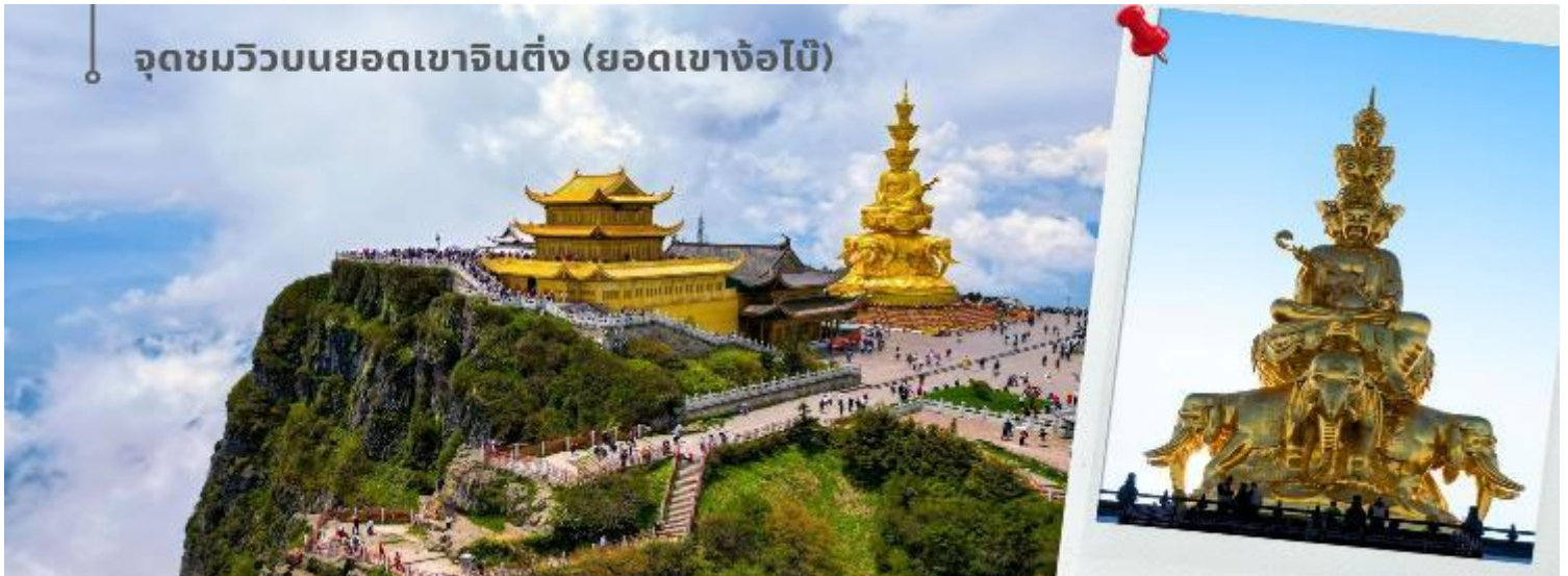
จุดชมวิวยอดเขาจินตึง (ยอดเขาจ้อไบ๊)

จากนั้นนำท่านชม วัดเป่ากั๋ว เป็นวัดที่ใหญ่และสวยงามที่สุดของจ้อไบ๊ เดิมชื่อว่าฮู่ยงจ้ง สร้างขึ้นในสมัยราชวงศ์ หมิง เพื่อบูชาพระโพธิสัตว์ผู้เสียนโพธิสัตว์แห่งปัญญาผู้สฤติย์ ณ เขาจ้อไบ๊ ซึ่งเป็นความเชื่อของ 3 ศาสนาคือ พุทธ เต๋า และ