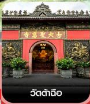
วัดต้าถิอ