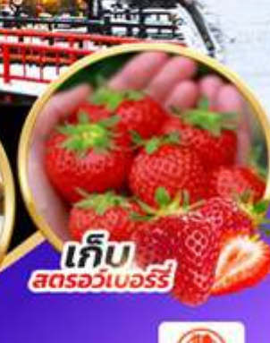
เก็บ สดรอว์เบอร์รี่

เที่ยวโทโฮคุ ตะลุยดินแดนปีศาจหิมะ นั่งกระเช้าชม SNOW MONSTER เต็มอิ่มกับกิจกรรมเก็บผลไม้