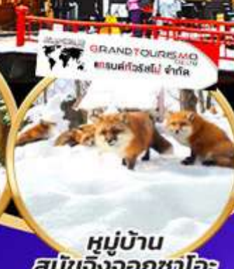
หมู่บ้าน สุนัขจิ้งจอกซาโอะ