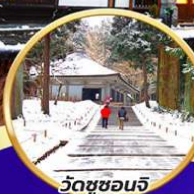
วัดชูซอนจิ