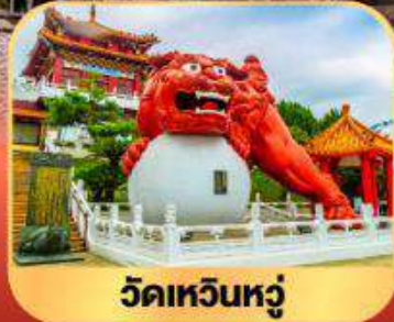
วัดเหวินหู