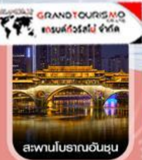
สะพานโบราณจีนฮุน