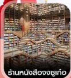
ร้านหนังสือจงซูเก๋