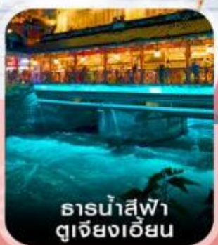
ธารน้ำสกีฟ้า ตุเจียงเอี้ยน