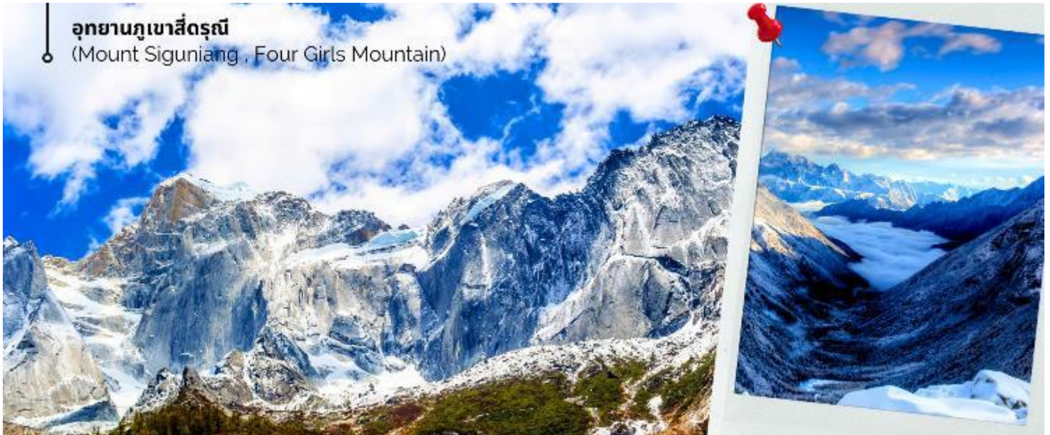
อุทยานภูเขาสิ่ดรุณี (Mount Siguniang , Four Girls Mountain)

ทำให้มีระบบนิเวศที่อุดมสมบูรณ์ นอกจากนี้ยังมีทะเลสาบขนาดเล็กกระจายตัวอยู่มากกว่า 25 แห่ง น้ำในทะเลสาบใสสะอาดและสะท้อนภาพของท้องฟ้าและภูเขาได้อย่างสวยงาม จากนั้นนำท่านเดินทางไปสัมผัสความงดงามของ หุบเขาซวงเฉียวโกว (รวมบริการรถในอุทยาน) ตั้งอยู่บนความสูงเหนือระดับน้ำทะเลราว 3,800 เมตร เป็นหุบเขาที่ลึกที่สุด แต่กลับท่องเที่ยวได้ง่าย เป็นจุดชมวิวอันตระการตาด้วยธรรมชาติที่อุดมสมบูรณ์และสวยที่สุดแห่งหนึ่งของที่เที่ยวในอุทยานภูเขาสิ่ดรุณีในระดับ 5A โอบล้อมด้วยทิวทัศน์ที่สวยงามจนได้รับฉายาว่า 'สวิตเซอร์แลนด์แดนมังกร' ท่านจะได้รู้สัมผัสกับทิวทัศน์ของธารน้ำใสสะท้อนเงาท้องฟ้าจนกลายเป็นสีคราม ในอ้อมกอดของภูเขาหิมะขนาดมหึมา ผสมผสานกับป่าไม้เขียวขจีราวกับดินแดนสวรรค์ ส่วนบริเวณใกล้เคียงยังเป็นที่ตั้งของหมู่บ้านชาวทิเบตที่มีวิถีชีวิตเรียบง่าย อีกจุดที่ควรค่าแก่การเข้าไปเยี่ยมชม สัมผัสวิถีแบบดั้งเดิมอย่างใกล้ชิด