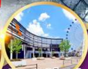
มิตซึเอากะเล็ดพาร์ค เซนได