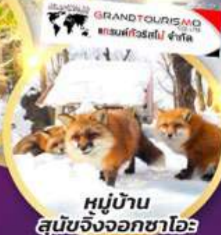
หมู่บ้าน สุนัขจิ้งจอกซาโอะ